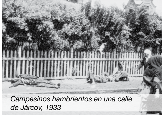
Campesinos hambrientos en una calle de Járkov, 1933

para convertirlas en cooperativas agrícolas. Después de la resistencia de los ucranianos a esta política, el gobierno comunista estableció políticas y acciones que produjeron una hambruna masiva 12 .