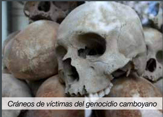
Cráneos de víctimas del genocidio camboyano

“Se estima que murieron entre 1.7 y 2 millones de camboyanos durante el reinado de cuatro años de los Jemeres Rojos” o “25% de la población del país” 14 . Muchos murieron por enfermedad, inanición y abuso en los campos de concentración o fueron ejecutados como enemigos del estado 15 .