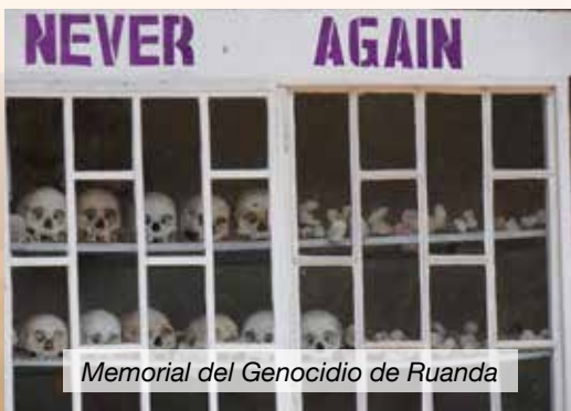
Memorial del Genocidio de Ruanda

Los miembros clave de la élite política hutu, muchos de ellos en altos cargos del gobierno, culparon a todos los tutsis y comenzaron una campaña de propaganda antitutsi en la radio. En cuestión de un día, todos los tutsis y los hutus moderados se convirtieron en el blanco de los hutus 22 .