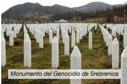
Monumento del Genocidio de Srebrenica

musulmanes bosnios en una campaña que los serbios denominaron “limpieza étnica”. Los militares serbios ingresaron a muchos bosnios por la fuerza en campos de concentración, en donde mujeres y niñas fueron violadas sistemáticamente y otros fueron torturados y asesinados. En 1995, en Srebrenica, los serbios cometieron una masacre contra 8,000 hombres y niños musulmanes en “edad de batalla” 18 . A lo largo de la guerra, las fuerzas serbias perpetraron numerosas ejecuciones masivas de civiles. Las fuerzas serbias violaron sistemáticamente a miles de mujeres y niñas durante el conflicto. Esto se denomina violación genocida, que consiste en la violación masiva contra quien se percibe como enemigo y forma parte de una campaña genocida 19 .