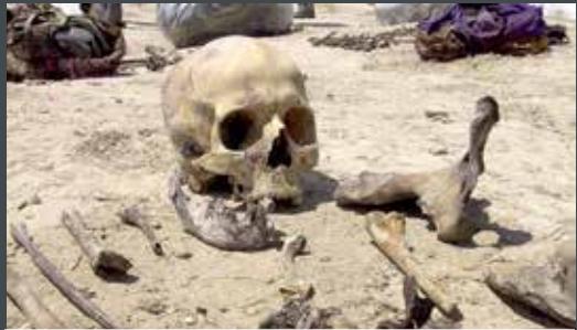
Restos humanos encontrados en una fosa común en el Kurdistán iraquí, 15 de julio de 2005

El 16 de marzo de 1988, los militares iraquíes lanzaron armas químicas en el pueblo kurdo de Halabja y mataron aproximadamente 5,000 civiles “con una mezcla letal de gas mostaza y los agentes nerviosos sarin y VX” 17 . Las fuerzas de Sadam destruyeron alrededor de 4500 pueblos kurdos y otros 31 pueblos asirios, con lo que desplazaron a 1 millón de personas.